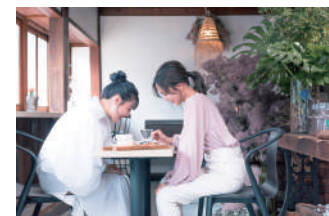
カフェでの一コマ