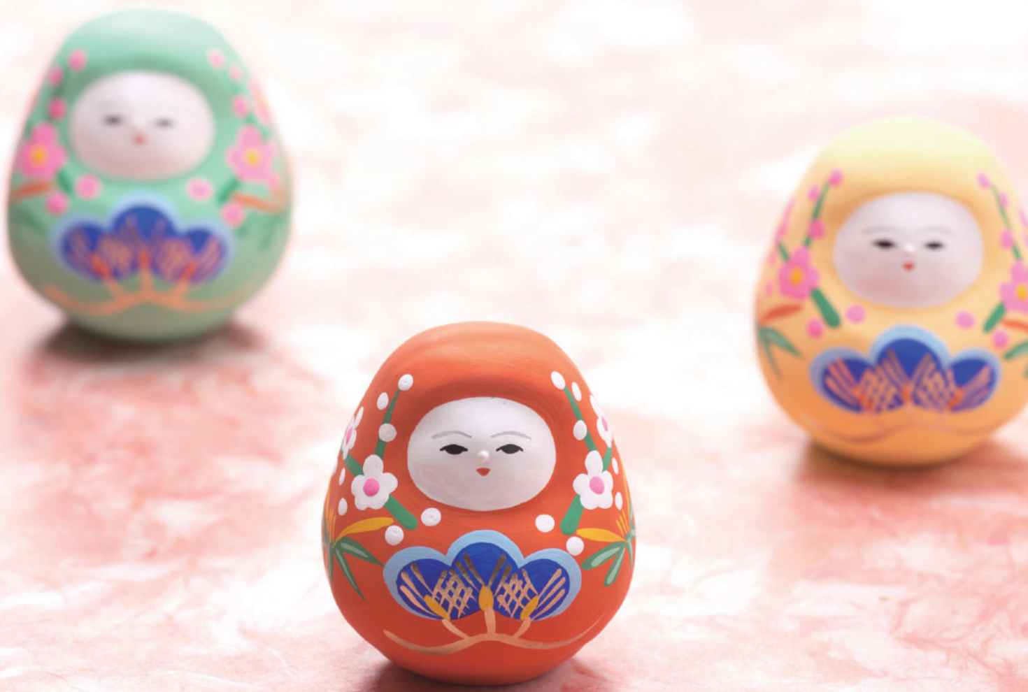
表紙写真:「加賀八幡起上り」(金沢市)