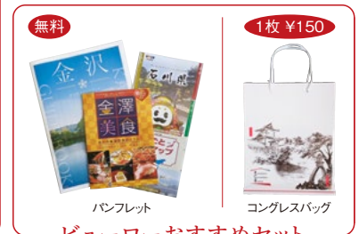
ビューローおすすめセット