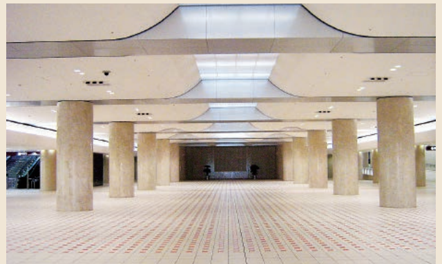
地下イベント広場