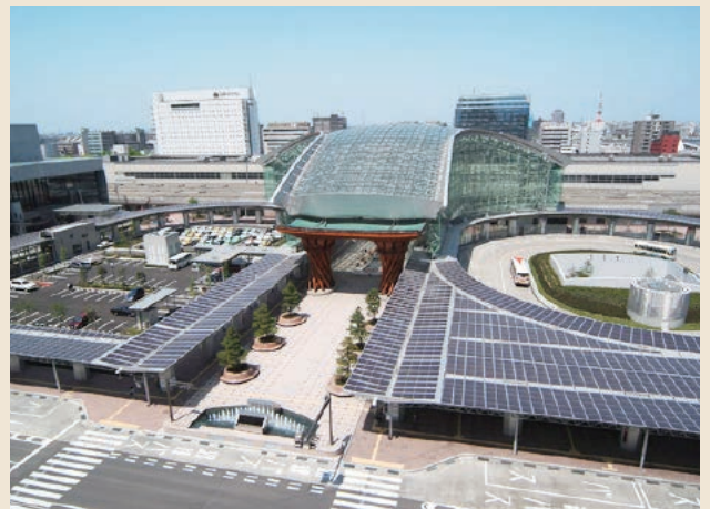
JR金沢駅もてなしドーム（地上部）

〒920-0858 金沢市木ノ新保町2番地 金沢駅前イベント広場運営センター TEL: 076-221-5952 FAX: 076-221-5952 URL http://www4.city.kanazawa.lg.jp/29210/ibentohiroba/ibento.html