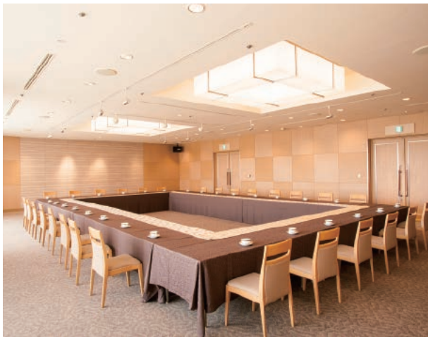
エクセレントルーム