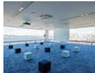
セミナールーム 大型スクリーン完備で120名まで対応できます。

開館時間:9:00~21:00(金沢港まなび体験ルーム9:00~17:00) 休館日:12月29日~1月3日 入館料:無料 お問合せ:金沢港クルーズターミナル 金沢市無量寺町リ-65 TEL 076-225-7030 URL http://www.kanazawa-cruise.jp/