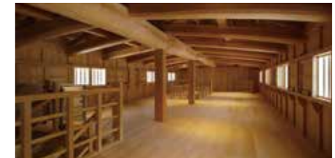
鼠多門内観(令和2年6月撮影)

開館時間:9:00~16:30(入館無料) 休館日:年中無休 お問合せ:金沢城・兼六園管理事務所 TEL:076-234-3800 URL: http://www.pref.ishikawa.jp/siro-niwa/kanazawajou/index.html