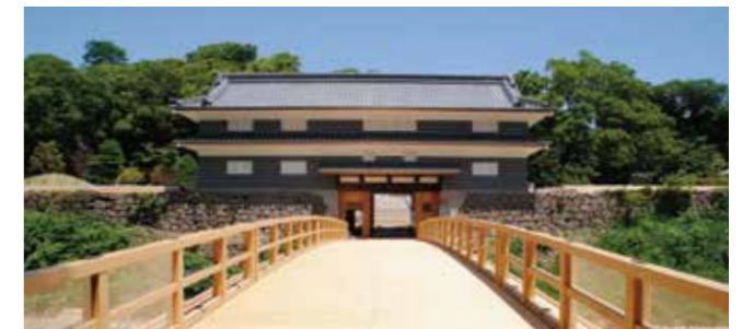
鼠多門と鼠多門橋(令和2年6月撮影)

7月18日に完成式が行われました。今後、貸館の予定もあり、アフターコンベンションへの使用も期待されます。