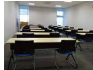
会議室 収容人数24名。